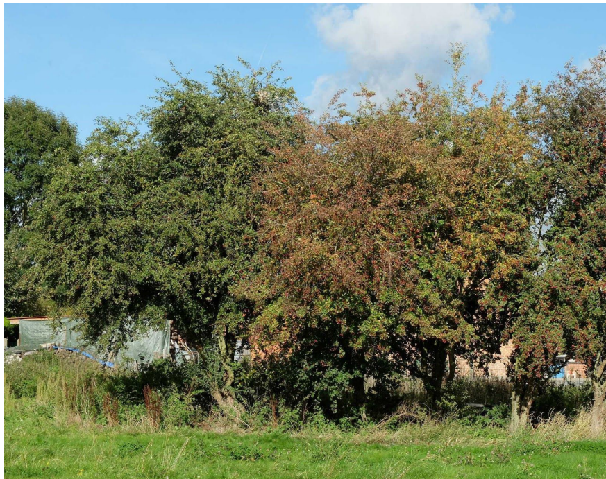
FIGURE 4 - Nid de frelon asiatique à Péronnes-Lez-Antoing

A côté de ces 2 nids, des attaques ont été signalées le 25.09 dans un rucher de la rue de la Vallée à Ham-sur-Heure-Nalinnes. LH s'est rendu sur place le 26.09. Il a constaté les attaques dans ce rucher