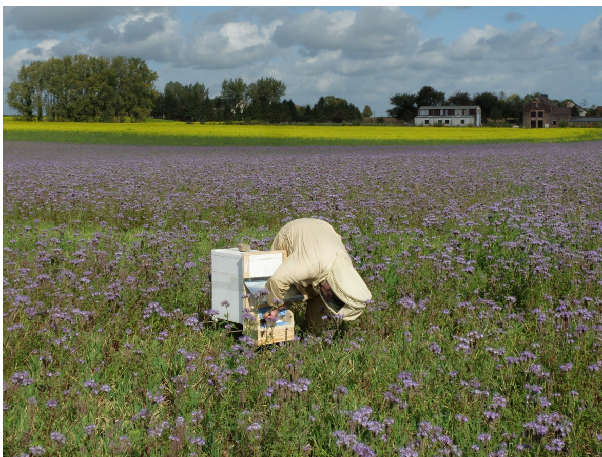
FIGURE 5 - Placement de la trappe à pollen

Afin de mesurer la capacité des cultures intercalaires pièges à nitrates (CIPAN) comme la moutarde ou la phacélie, une campagne d'échantillonnage de fleurs a été lancée fin septembre dans toute la Wallonie. A l'intérieur de chaque parcelle visitée, un échantillon de 2 x100 fleurs est prélevé en laissant 10 m de bordure et en circulant en diagonal dans la parcelle. Afin de collecter du pollen, des colonies équipées d'une trappe ont été placées dans des champs occupés par des CIPAN. Actuellement 10 sites ont été échantillonnés dans les alentours de Gembloux. Une fois que la quantité nécessaire pour les analyses sera récoltée, les ruchettes seront déplacées dans une autre région pédoclimatique. Toutes les fleurs collectées et le pollen de trappe sont congelés à -20°C. Ces 2 matrices seront envoyées pour des analyses de résidus dans un laboratoire après un appel d'offre pour ces 2 matrices.