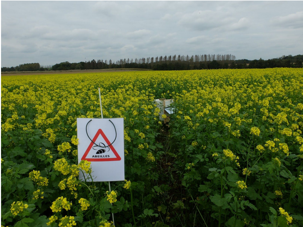
FIGURE 6 - Champ de moutarde échantillonné à Lonzée