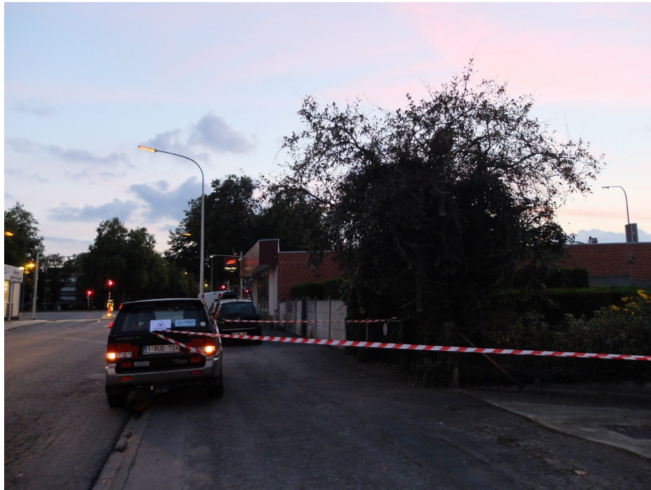
FIGURE 3 - Nid de frelon asiatique à Tournai